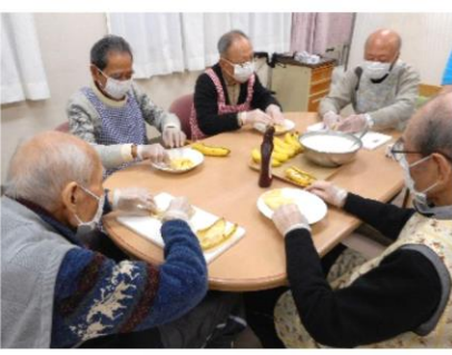
男の料理教室はバナナクレープなんてものを作ってみました。なんとものを作ってみました。