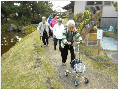
↑こんな感じの足場の下屋敷跡の中を皆でテクテク歩き回って来ました。