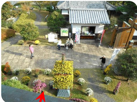
↑ココからヨレを撮影したよ