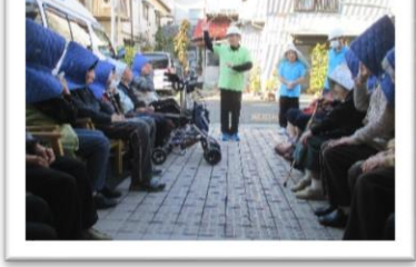
←防災訓練を真面目にやりました。備えあれば憂いなし。