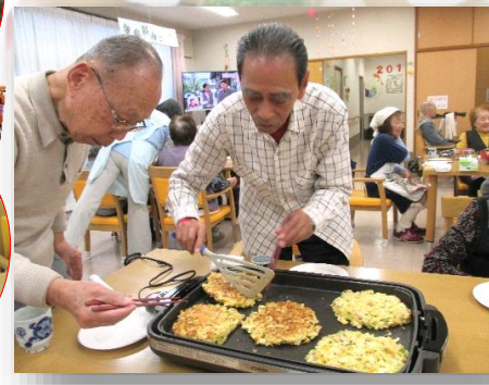
「みんなでおしゃべり飯を作ろう会」です。今回はお好み焼きと焼きそばで各自自分の食べる分を焼きました。