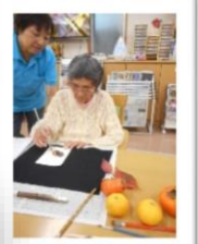
小さくてすみません。絵紙教室の様子です。秋の食べ物素材にしています。