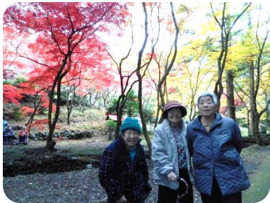
新聞記事を見て羽鳥の洞慶院まで紅葉を見物しに行きました。色とりどりのそれは見事な紅や黄色の木々でした。