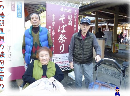
この時期恒例の駿府匠宿のそば祭りに行ってきました。曜日によって催し物が若干違いますが、色んな面白い物したりお昼がてら蕎麦を食べたりして楽しんで来ました。