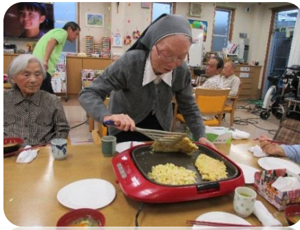
各々自分の分のタネをしつかりこねてからじつくり焼いていきました。その後皆で美味しく頂きました。