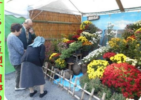
毎年恒例、静岡県護國神社の菊花展に皆で行って来ました。