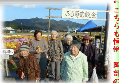
↓これがざる菊です。広々とした場所にズラリと並ぶ菊はそれは壮観なのだ