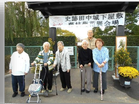
今年も藤枝の田中城下屋敷跡の菊花展に行ってきました。