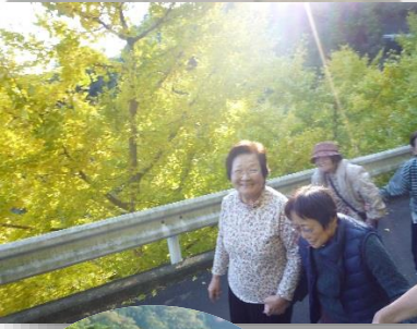
徳願時の途中にとてもぎらない銀香の葉がズラリと並んでたよ