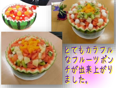
とてもカラフルなフルーツポンチが出来上がりました。