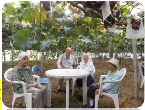
安倍街道沿い福田ヶ谷にあります