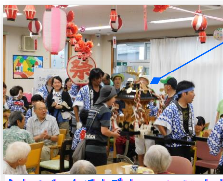
↑人でごった返すダイルームでした↓