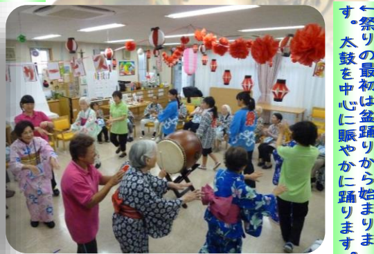
←祭りの最初は盆踊りから始まりです。太鼓を中心に賑やかに踊ります。