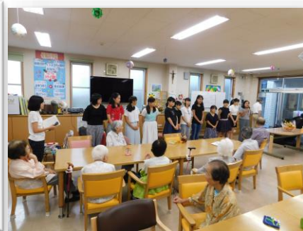
毎年恒例不二聖心女学院の生徒さんが遊びに来てくれました。