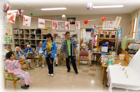
↑が「射的」↓が「魚釣りゲーム」です。景品があるので皆さん夢中にやっています。