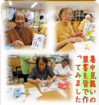
暑中見舞いの葉書を皆でいたつてみました