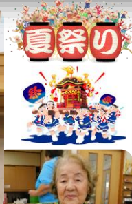
景品を持って帰りました。皆様が満更の持帰りでます。