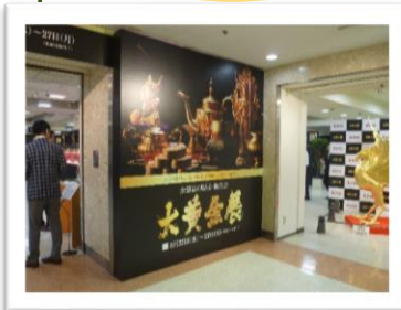
静岡伊勢丹で大黄金展をやっていたので見るのはタダと見物に行ってきました。後の鳳凰は数千万円だった。