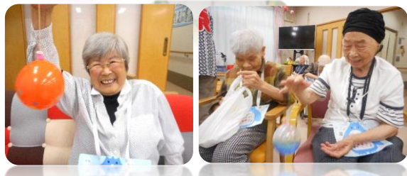
↑こちらは「ヨーヨー釣り」の様子です。結構真剣