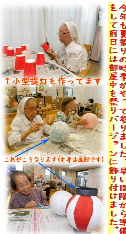
↑小型提灯を作ってます