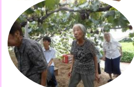
→ぶどう狩りをしたいねっ。味を見学に行ったらこらしよと沢山の美味いぶどうを試食させてくれました