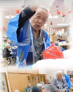
↑こちらは「ヨーヨー釣り」の様子です。結構真剣