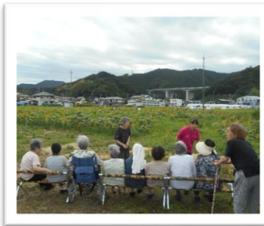
遠藤新田にあるひまわり畑です。花は小ぶりでしたが、ベンチに座ってのんびり眺めて来ました。