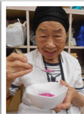
↑かき氷はシロップも色々種類を用意して皆で美味しく頂きました。