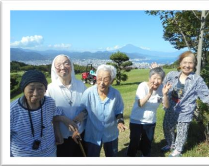
↑日本平山頂です。後ろには綺麗な富士山がスコーンと見えています。