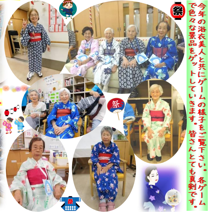
今年の浴衣美人と共にゲームの様子をご覧下さい。各ゲームで色々な景品をゲットしていきます。皆さんとても真剣です。