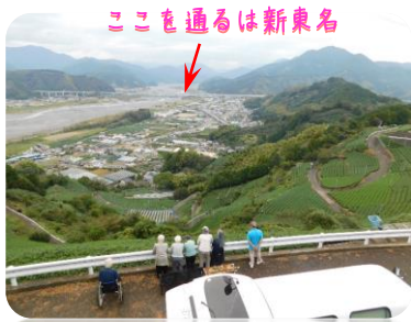
ここを通るは新東名

多分普通には行けない場所に行っているかん高い所からお茶畑や安倍川を眺めて来ました。