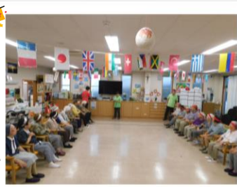
↑競技開始前の静かなひととき。ほらかな身体をあたためてからさあ、ラジオ体操をやりましょう！

運動会は十月中旬でしたが、メインの行事なので、多めに掲載します。皆様の笑顔と必死の表情をご覧ください。