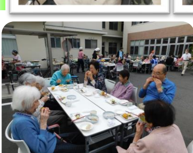
栄養課主催、特養と合同で中庭で『芋煮会』を開いて下さいました。サンマも炭で焼いてくれてとても美味しそうでした。皆さん大喜び。