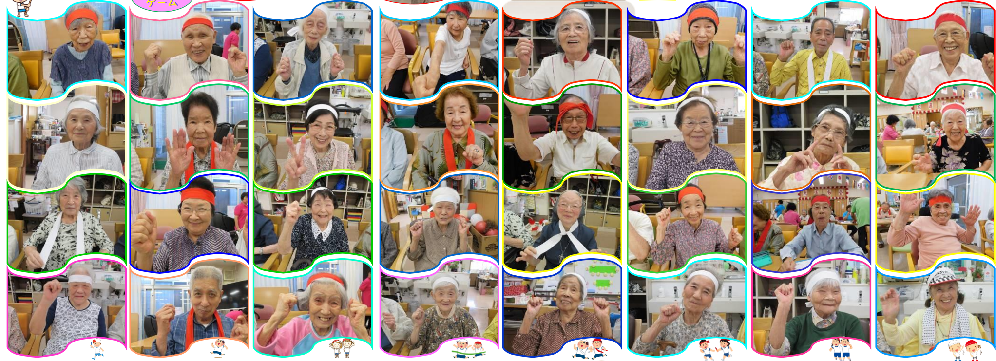
皆さんの気合の雄姿をご覧下さい。この時は笑顔満ちて、競技に入ると結構夢中になって熱くなる方続出でした。