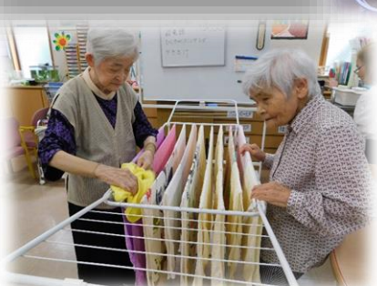
↑↓食後のひと時、午前中の入浴で出た洗濯物を干して下さっている皆様。有難う御座います。