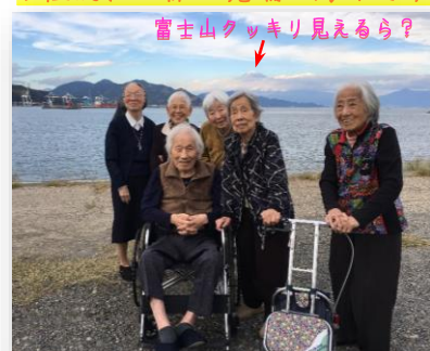
富士山クッキリ見えるら?