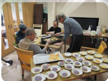
↑↓男の料理教室、今月はムラサキ芋使用の芋どら焼きです。