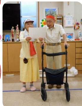
選手宣誓をしているKさんとOさん。これから始まりです。