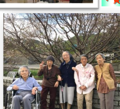
↑後の木は『10月桜』だそうです ↓恒例、三保の先端の海岸です