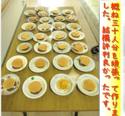
概ね三十人分を頑張ったです。結構評判良かったです。