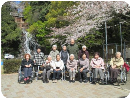
最後は桜と滝の前で記念撮影。皆さんまた来年も来ましょうね。