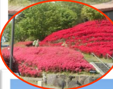
清水秋葉山公園のツツジです。