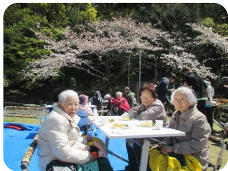
お昼はちらし寿司です。程よい暖かい日差しの下美味しく頂きました。