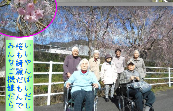
桜も綺麗だしいいやらんばいだしみんなご機嫌だら

いつもの愛宕霊園周りの桜と清水IC近くの秋葉山公園に花見に行ってきた。どちらも満開で見応え十分でした。