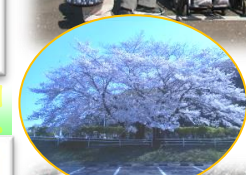
愛宕霊園の桜です。毎年な事くり見られます。