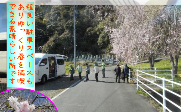
程良い駐車スペースもありゆつくり春を満喫できる素晴らしい所です

聖ヨゼフ定番の花見スポット湯山の枝垂れ桜です。今年もズラリと見事に咲いてくれました。のどかに観賞中の皆さん。