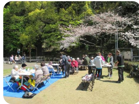
テーブルやイスを大量に持ち込んだので大がかりな花見となりました(*^^)v