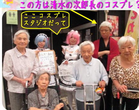
この方は清水の次郎長のコスプレ？ ここコスプレスタジオだって