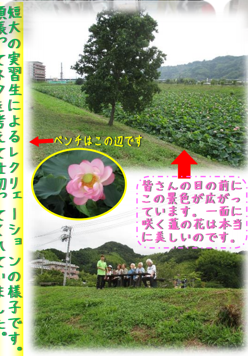
←ペンチはこの辺です