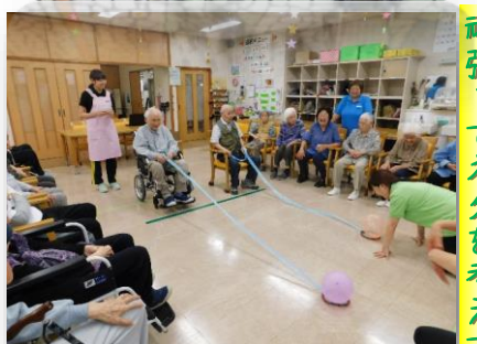
毎週土曜日2カ月に渡っての長〜い実習の成果を試している所です。皆さん楽しんで下さったでしょうか？