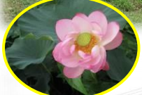
皆さんの目の前にこの景色が広がっています。一面に咲く蓮の花は本当に美しいのです。